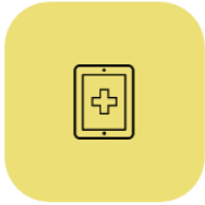
Tràmits i serveis