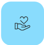
Voluntats i donacions