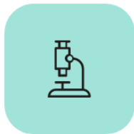
Informes i resultats